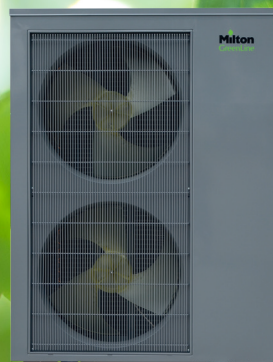
Udedel 15 og 19 kW

Konstruktionen betyder også et yderst lavt lydniveau ned til 52 dB(A) målt efter ErP standarden.