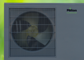
Udedel 6, 9 og 12 kW