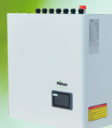
Indedel uden VVB