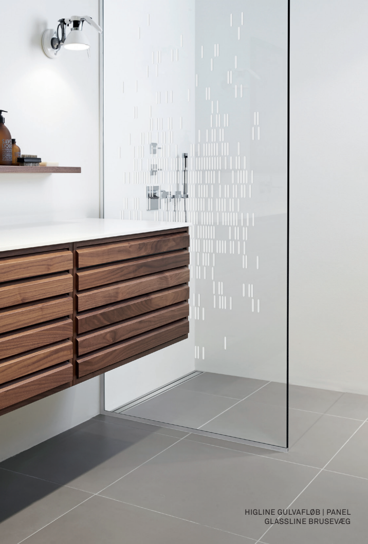
HIGLINE GULVAFLØB | PANEL GLASSLINE BRUSEVÆG

I 2003 opfandt Unidrain det første lineære gulvafløb, der kunne placeres mod væggen i brusenichen. I løbet af få år udviklede Unidrain sig til en af Danmarks førende gulvafløbs-producenter, og siden er der kommet adskillige produkter til. Unidrain har modtaget flere internationale designpriser og er i dag repræsenteret i mere end 30 lande spredt ud over hele verden.