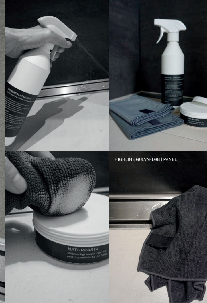
HIGLINE GULVAFLØB | PANEL