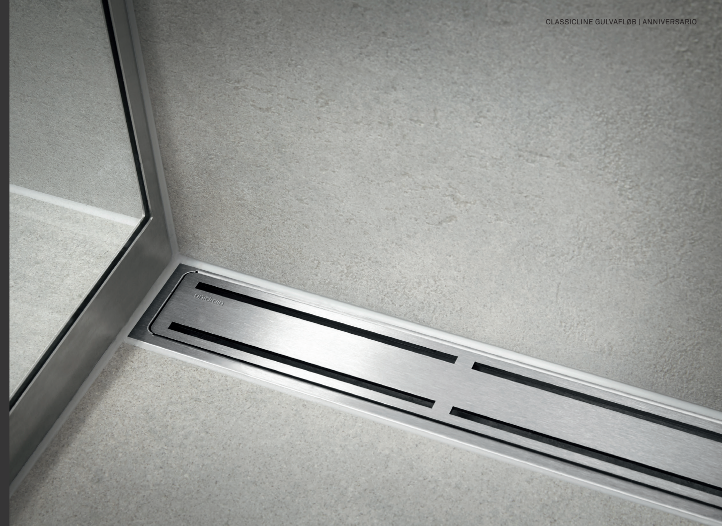
CLASSICLINE GULVAFLØB | ANNIVERSARIO

I 2003 opfandt Unidrain det første lineære gulvafløb, der kunne placeres mod væggen i brusenichen. I løbet af få år udviklede Unidrain sig til en af Danmarks førende gulvafløbs-producenter, og siden er der kommet adskillige produkter til. Unidrain har modtaget flere internationale designpriser og er i dag repræsenteret i mere end 30 lande spredt ud over hele verden.